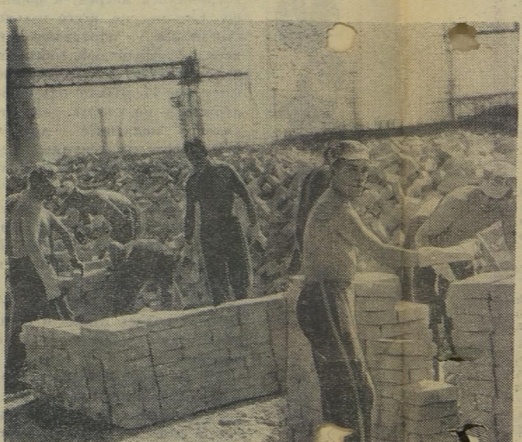
«Из одного металла льют медаль за бой, медаль за труд».