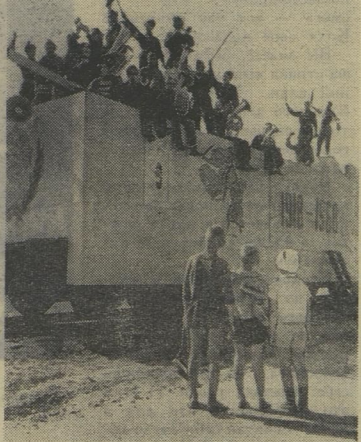
Пришёл на станцию, как в гражданскую войну, комсомольский бронепоезд. Глазам не верить!