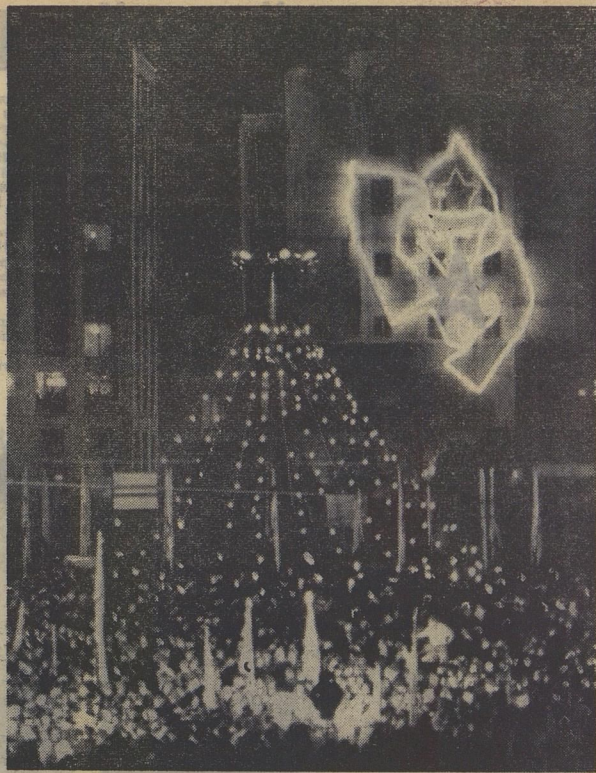
Празднично, торжественно выдвигал Киев в дни IV Всесоюзного слёта.